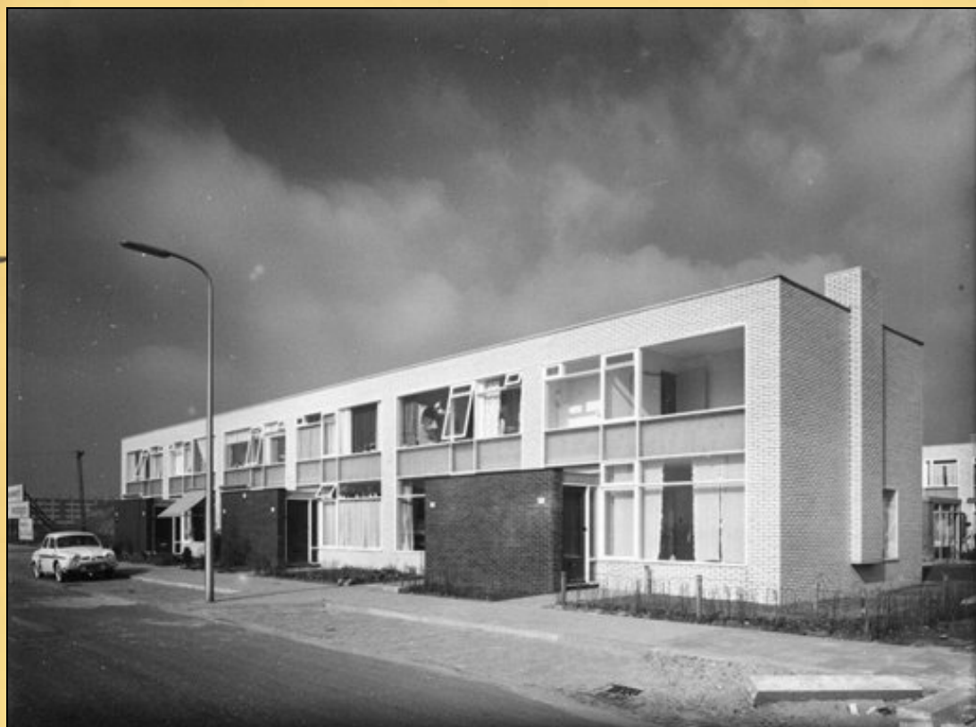
Afb. 1: Huizen aan de Koningin Wilhelminalaan (rond 1960) naar een ontwerp van Gerrit Rietveld.